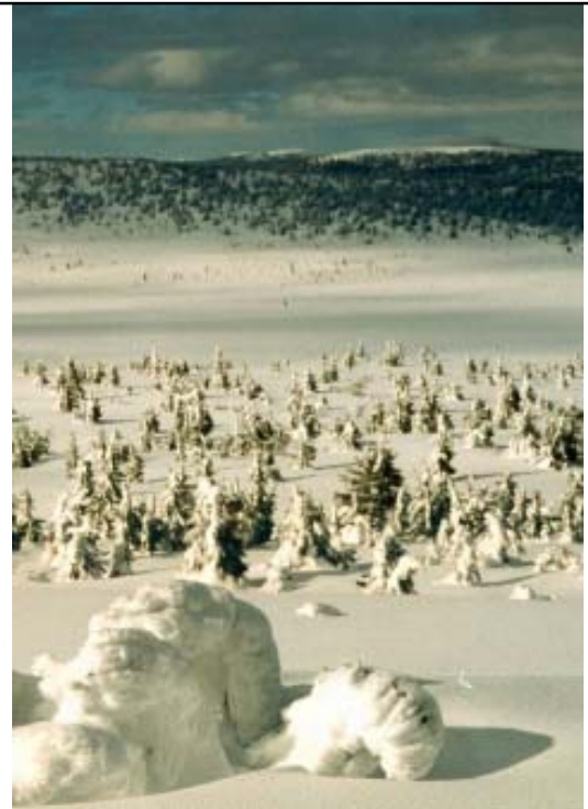
Gråfjell i vinterdrakt.