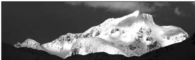
Møysalen, Hinnøya.

Målgruppe for konferansen er alle som er opptatt av hvordan forvaltningen skal forholde seg til støy, stilhet og ro.