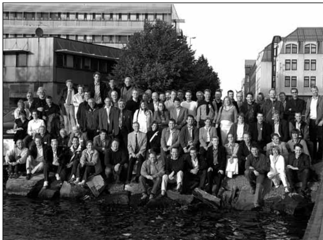
Norsk Akustisk Selskap, ved halvparten av dem.