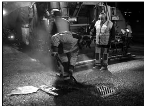
"Tette tynndekker" ble i høst lagt ut på Kirkeveien utenfor Ullevål sykehus.

- Utfordringen er å få miljøvennlig asfalt til å fungere under norsk vinterklima og piggedekkbuk. Riktig sammensetning, bruk av modifiserte bindemidler og sterke steinmaterialer er hovedstikkord for å lykkes, forklarer Aksnes. Dersom politikerne åpner pengesekken kan mange veier etter hvert få ny støysvak asfalt. Det kan hjelpe mange av dem som i dag plages av støy langs norske veier.