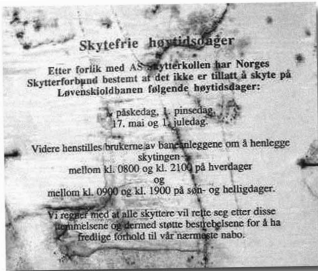
NORGE 2006: Oppslag på Løvenskioldbanen, november 2006. Trolig har oppslaget hengt der i mer enn ti år.

Støyforeningen politianmeldte den 8. desember de ansvarlige for Løvenskiold skytebane i Bærum kommune for brudd på lov om helligdagsfred. Loven skal sikre folk stillhet på helligdager. Skytebanen har gjennom mange år holdt åpent på søndager og de fleste øvrige helligdager, i tillegg til skyting på hverdagens.