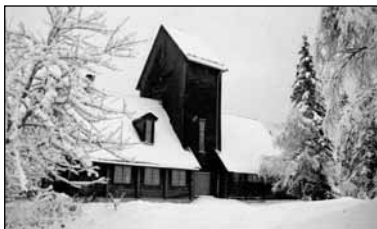
Adkomsten til Haslumseter kapell er i hovedsak opp åsen bak Løvenskioldbanen. Skytestøyen er godt hørbar der også.

Støyforeningen politianmeldte den 8. desember de ansvarlige for Løvenskiold skytebane i Bærum kommune for brudd på lov om helligdagsfred. Loven skal sikre folk stillhet på helligdager. Skytebanen har gjennom mange år holdt åpent på søndager og de fleste øvrige helligdager, i tillegg til skyting på hverdagens.