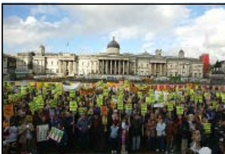
Protest Trafalgar Square oktober 2000 Kommunane rundt Stansted flyplass utanfor London fryktar planar om 127 millionar passasjerar i 2030, frå Gardermoen nivå på 12 millionar i 2000

Innan juli 2006 skal EU-kommisjonen komme med framlegg til underdirektiv på fleire område, herunder eit om flystøy. Eit formål med konferansen var å bidra til fortgang i arbeidet med flystøydirektivet. Kommisjonen er motvilleg. Støyforeningen var der.