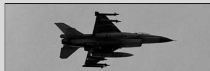
Norsk F16 jagerfly.

Palestinske helsemyndigheter kritiserer Israels bruk av lyd bomber over Gazastripen, der kampfly flyr over området i lav høyde, ofte om natten. Når flyene bryter lyd muren, skapes store sjokkbølger. De opplyser at støyen er svært smertefull for ørene, traumatiserer barn og forårsaker neseblødning, hjerte problemer og spontanaborter, melder NRK.