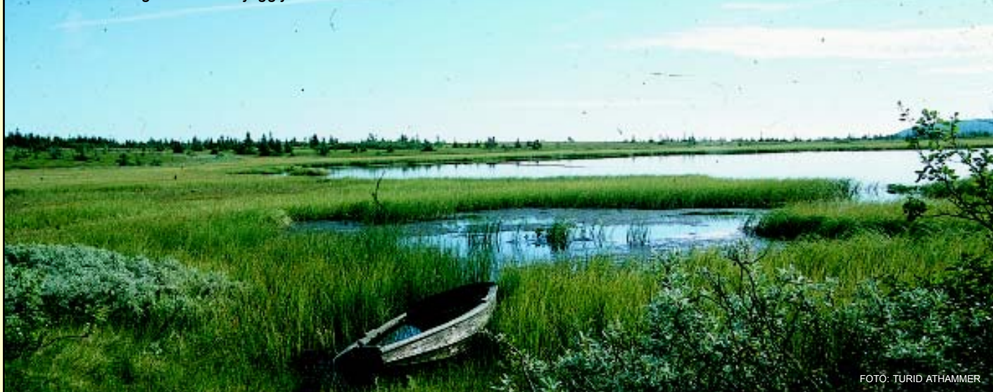
Sommerstemning ved Finnskjeggtjernet

Tiltakshaver (Forsvaret) søker i konsesjonsrunden å innføre et helt nytt støyregime, som heller ikke er faglig gjennomdiskutert. Dette gjør det svært lite tilfredsstillende for kommunen å ikke kunne bruke sin myndighet til regulere støyforholdene gjennom reguleringsplaner, men i stedet måtte avvente en framtidig konsesjon. At støy spørsmålet ikke avklares nærmere i plansammenheng vil også for Åmot kommune kunne føre til usikkerhet – ikke minst politisk – i forbindelse med den kommende byggesaksbehandlingen.